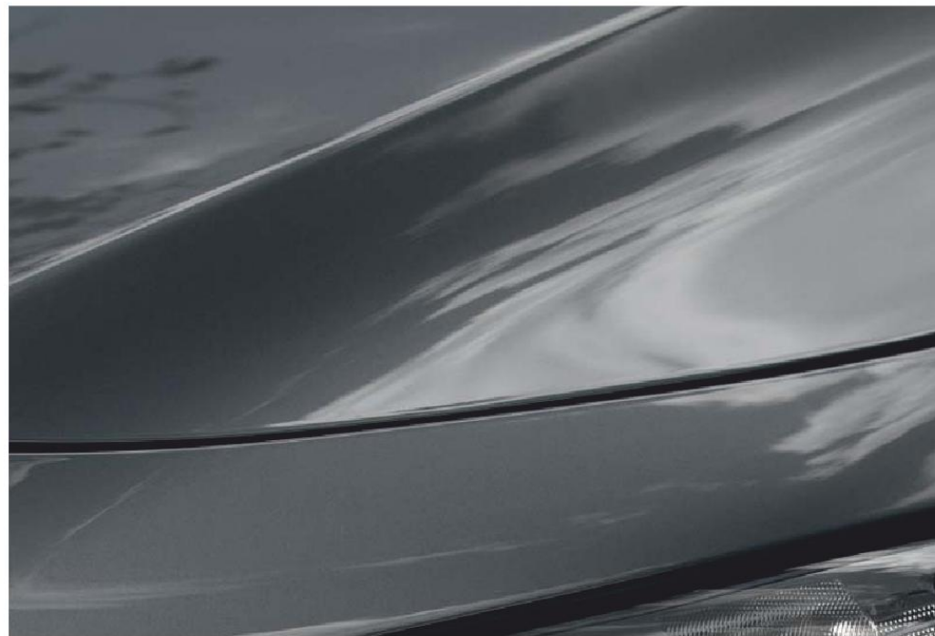
Sivá Machine Gray

Navštívte našu webovú stránku www.mazda.sk , kde nájdete všetky dostupné živé farby.