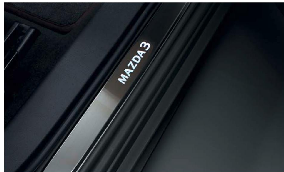
Osvetlené prahové lišty