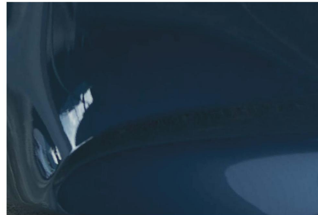
Sivá Polymetal Gray